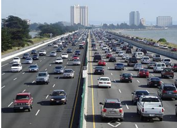
Imagem de uma rodovia